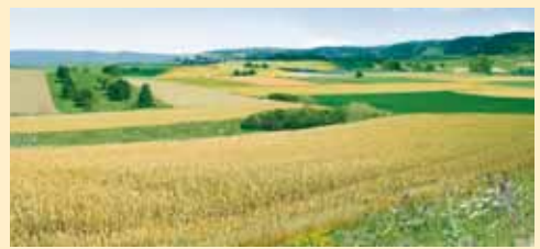
Agroscope Reckenholz-Tänikon ART